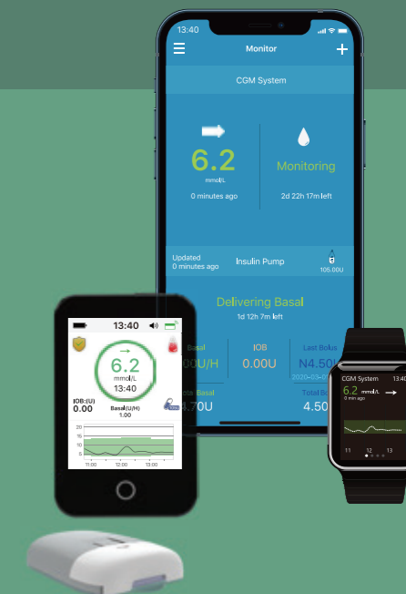
EasyTouch App (iOS & Android)